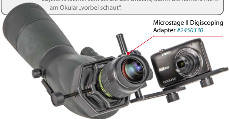
Microstage II Digiscoping Adapter #2450330

Durch die große Augenlinse der Morpheus®-Okulare können Sie auch größere Kompaktkameras verwenden; idealerweise sollte die Linse des Kameraobjektivs kleiner sein als die des Okulars, damit die Kamera nicht am Okular „vorbei schaut“.